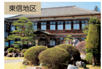
旧大沢小学校（佐久市）