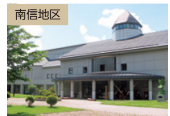
茅野市八ヶ岳総合博物館（茅野市）