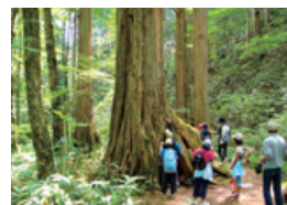
水木沢天然林 (木相村)