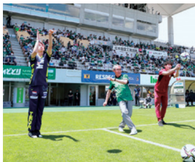
松本山雅FCのスポンサーマッチデー「ながぎんデー」の開催 県内他プロスポーツチームとのコラボレーション