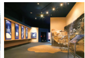
星くずの里たかやま黒耀石体験ミュージアム (長和町)