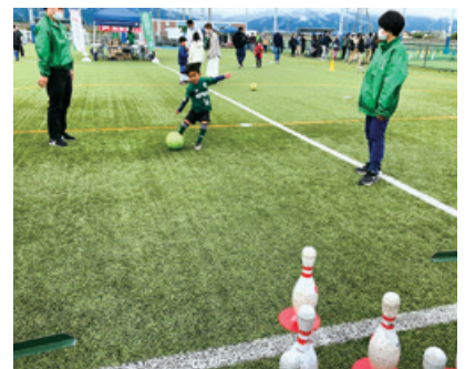
～多世代が楽しめるスポーツの日～を松本山雅FCと共催 多くのご来場者が様々なスポーツを体験