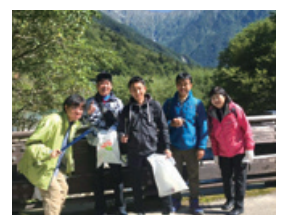
上高地の皆さまと地域活性化の活動