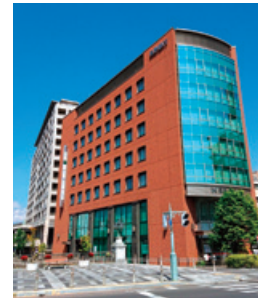
ながぎん松本センタービル完成（2004年）