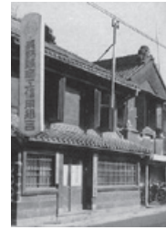
創業当時の本店（1950年）