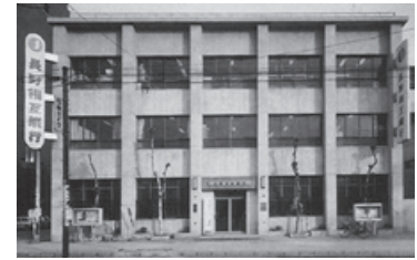
相互銀行に転換当時の本店（1970年）