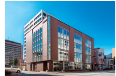
ながぎん長野センタービル完成（2015年）