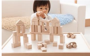
（郡上八幡のくるま付積み木）