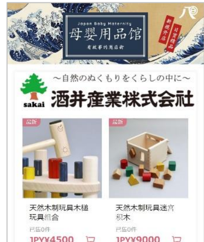
（「八百万商店街」サイトイメージ）

※写真は当プレスリリース時点でのイメージです。実際の展示とは異なる場合がございます。