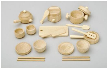
（森のお食事セット）

酒井産業は、国内の木材加工産地と連携し、木の素材が持つ優しさ、伝統技術などを活かし、「日本の木の文化」を感じられる逸品を提供しています。「八百万商店街」には、「天然素材のやわらかな、木のぬくもりを子供たちに届けたい」という思いから生まれた天然木のおもちゃなどを出品し、中国市場での売上拡大を目指します。