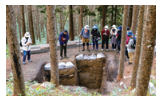
国史跡 星ヶ塔黒曜石原産地遺跡 [下諏訪町]