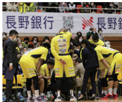
信州ブレブウォリアーズのタイトルパートナーとしてゲームを共催