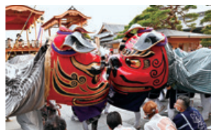
篠ノ井の大獅子[長野市]