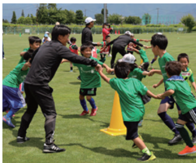
松本山雅FCのスポンサーマッチデー「ながぎんデー」の開催 県内他プロスポーツチームとのコラボレーション