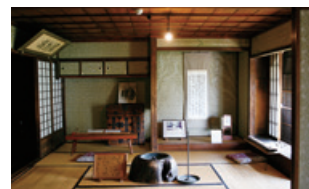
高井鴻山記念館[小布施町]