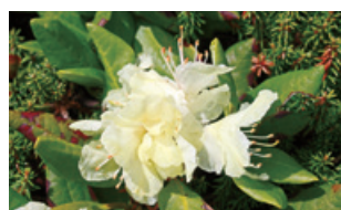
ハケ岳ヤエキバナジャクナゲ 自生地[南牧村]