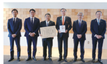
長野県庁での贈呈式の様子

当行は、今後も引き続き長野県の実現に貢献するとともに、SDGsの目標達成に向けて、持続可能な社会の実現に取り組んでまいります。